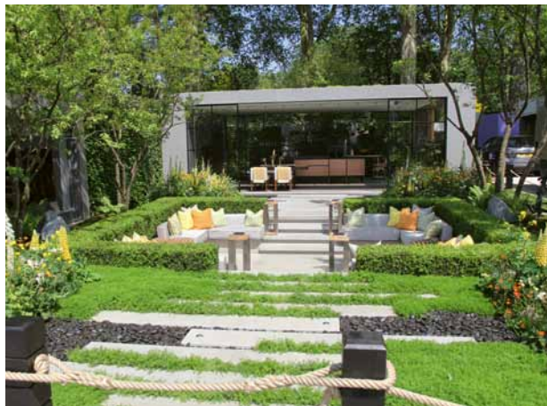
Unterschiedliche Höhen und Tiefen sorgen für Abwechslung und schaffen intime Orte.

Wind zu schützen. So entsteht ein ruhiger und geborgener Raum, in dem die Gartenbesitzer die Natur besser wahrnehmen können. Man schafft einen neuen Aufenthaltsort, der zum Entspannen einlädt – idyllisch, beschaulich, romantisch und intim.